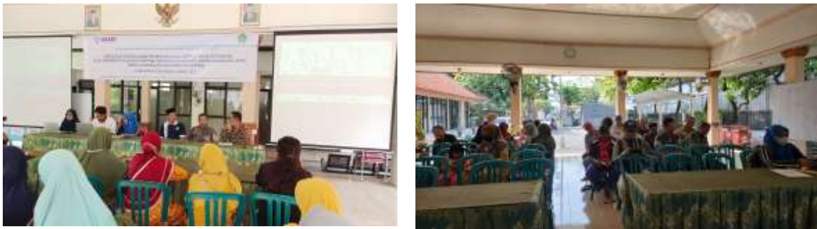
Gambar 3. Sosialisasi Program Sanitasi dan Hygiene (IUWASH) di Desa Larangan