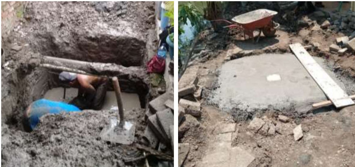
Gambar 4. Pembangunan Septic Tank Komunal di Desa Larangan